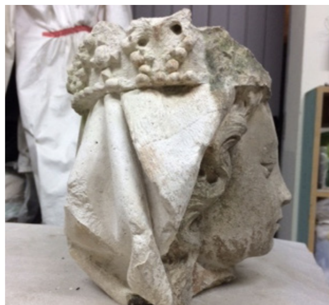
La tête de la Vierge à l'enfant a fait l'objet d'un test de nettoyage concluant, sur la partie arrière : la pierre micritique (très fine) se révèle d'une blancheur éclatante.