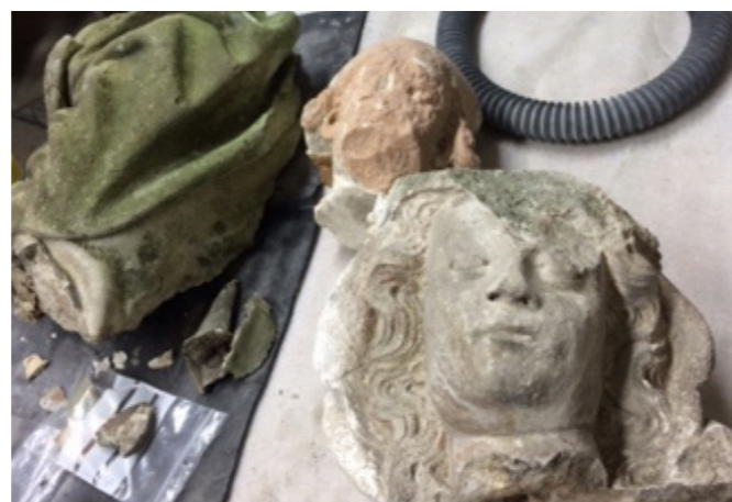
Sur la table de travail, des éléments des deux sculptures : les têtes, un fragment encore recouvert de mousse de la Vierge, des échantillons prêts pour l'analyse et quelques déchets de colle acrylique, inopérante.

pourra être analysée pour confirmer sa provenance (en Bourgogne ?). L'enquête s'ouvre, avec le concours de spécialistes à consulter, au musée du Louvre et en Champagne.