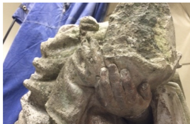
Détail de la main de la Vierge portant l'enfant : malgré les mousses encore présentes on distingue différentes finitions, différents effets sur la pierre sculptée qui rendront à la fin du travail tout leur éclat.